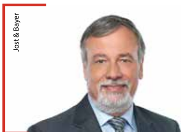
Jost &amp; Bayer